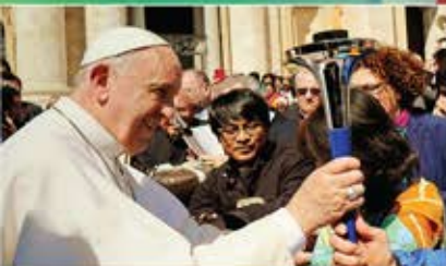
Le pape François bénit le flambeau à Rome.