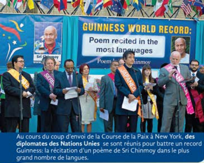
Au cours du coup d'envoi de la Course de la Paix à New York, des diplomates des Nations Unies se sont réunis pour battre un record Guinness: la récitation d'un poème de Sri Chinmoy dans le plus grand nombre de langues.