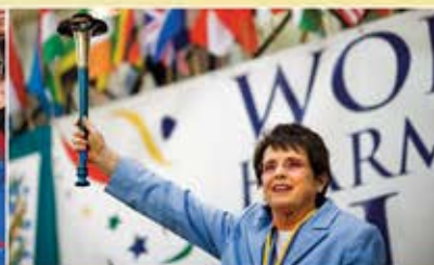
La légende du tennis, Billie Jean King, participe au lancement mondial à New York.