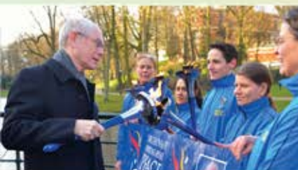
M. Herman Van Rompuy, président du Conseil européen de l'époque, allume les flambeaux du relais européen.

Le programme « Torch Bearer Award » reconnaît les efforts de pionniers de la paix issus de tous les groupes d'âge.