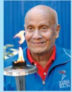
Sri Chinmoy Fondateur