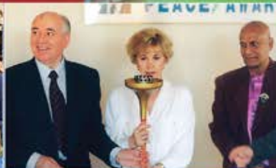
L'ancien président soviétique, Michael Gorbachev et son épouse, Raisa Maximovna, tiennent le flambeau sous le regard de Sri Chinmoy.