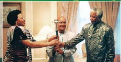
Nelson Mandela, l'ancien président de l'Afrique du Sud et son épouse, Mama Graça Machel, en compagnie de Sri Chinmoy.