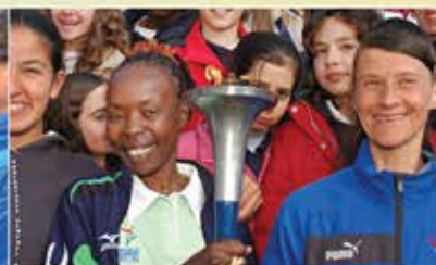
L'ancienne détentrice du record du monde du marathon, Tegla Loroupe, en compagnie d'enfants en Italie.