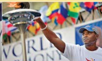
La légende olympique, Sudhota Carl Lewis, allume le flambeau pendant la cérémonie d'ouverture à New York.