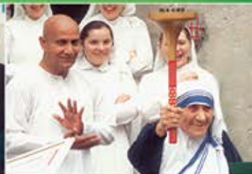
Mère Teresa et Sri Chinmoy célèbrent l'esprit de l'harmonie.