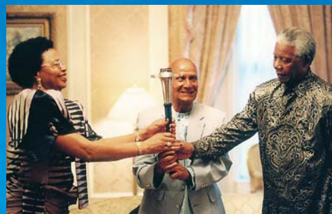
Nelson Mandela , former President of South Africa, and his wife Mama Graça Machel with Sri Chinmoy.