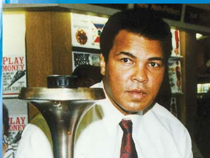
Muhammad Ali , world renowned boxing great, reflects on peace.