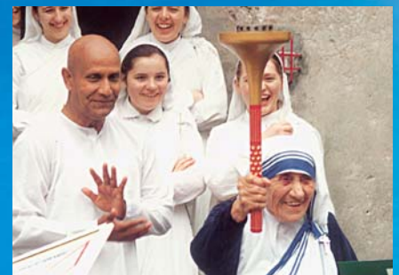
Mother Teresa and Sri Chinmoy celebrate the spirit of peace.