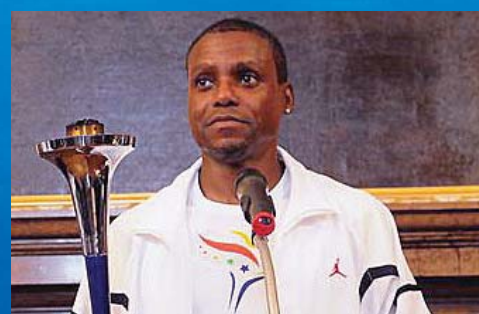
Nine-time Olympic gold medalist Carl Lewis speaks about the goals of the Run.