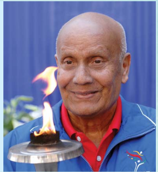
FOUNDER – Sri Chinmoy

親穆儀上師生前是运动家, 哲学家, 艺术家, 音乐家和詩人。他一生献身於世界友谊和同一的理想。