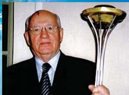
Former Soviet President Mikhail Gorbachev holds the torch.

Following an opening ceremony in Auckland on November 10 , our New Zealand Peace Run team will journey over six days to the capital city of Wellington. Team members will cross the Cook strait by ferry then proceed down the east coast of the South Island to Christchurch and a closing ceremony - the grand finale to the 2014 Asia-Pacific Peace Run - on November 21 .